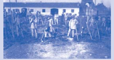
Scuola agraria per orfani di guerra