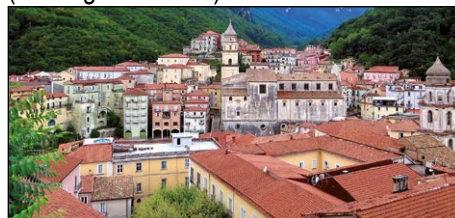
Campagna (Sa) Rassegna Internazionale di Teatro Educativo&Sociale "IL GERIONE"

In Italia esiste il Coordinamento R.A.R.E. (Rassegne in Rete) costituito da oltre 40